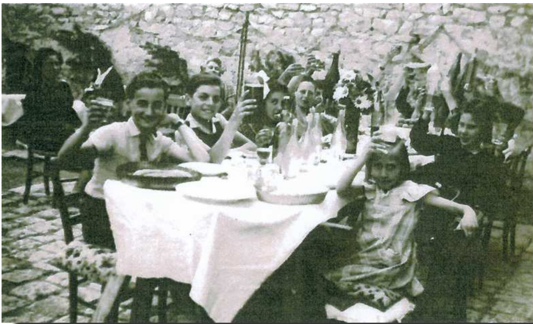
Les enfants de la rue Charlet à la libération.

Par bonheur il n'y eut jamais de bombardement au dessus de la rue Charlet.