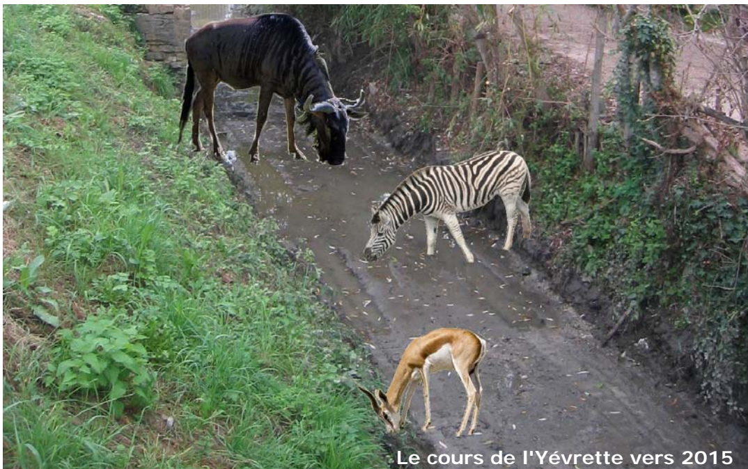
Le cours de l'Yévrette vers 2015

en ont fait ce que d'aucuns par le passé décrivaient comme un égout à ciel ouvert (justifiant, ainsi au passage, son comblement pour en faire un parking)... Ces temps sont derrière nous et chacun s'accorde à dire désormais que ce brin de ruisseau au cœur de la ville est une respi-ration indissociable des marais tout proches.