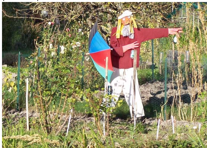
Entre autres, le promeneur immobile...