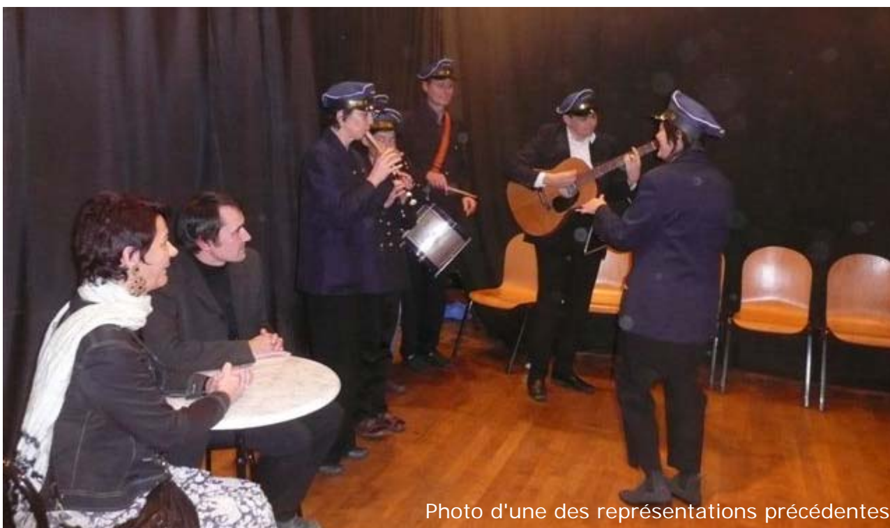
Photo d'une des représentations précédentes