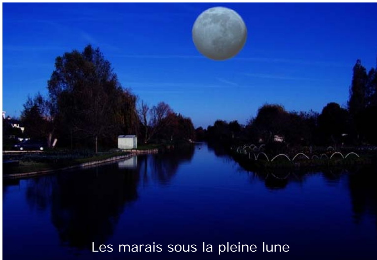
Les marais sous la pleine lune

peut être ; et c'est sans doute là l'une des fonctions premières de ces serments pas toujours honorés : espérer, imaginer en mieux notre vie à venir.