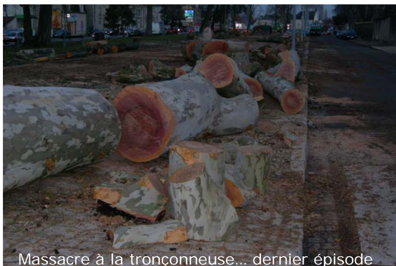
Massacre à la tronçonneuse... dernier épisode