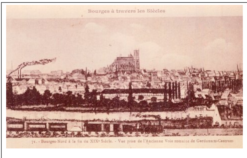
Bourges-Nord à la fin du XIX ème siècle ~ Vue prise de l'ancienne voie romaine de Gordonum-Castrum

La gare du chemin de fer, le petit séminaire Saint-Célestin, aujourd'hui école supérieure et professionnelle, la fonderie de canons, l'école centrale de Pyrotechnie, l'école des nouvelles casernes d'artillerie, l'hôpital militaire, le château d'eau place Séraucourt, les nouveaux boulevards, le marché couvert près de la place Saint-Bonnet, sont construites, ainsi qu'une multitude d'écoles et d'hôtels remarquables ; la halle aux grains a aussi reçu une transformation appréciable, sa vaste cour centrale est couverte par un immense vitrage.