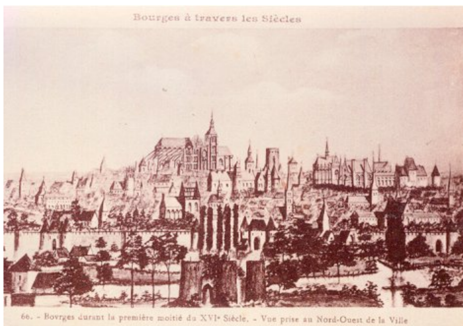
Bourges durant la première moitié du XVI e siècle Vue prise au Nord-Ouest de la ville