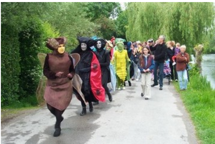
Les insectes en procession, suivis par le public

A l'issue de cette balade, un goûter a réuni les participants sur la place jouxtant la passerelle Nérault, pour terminer ce moment de plaisir et de poésie.