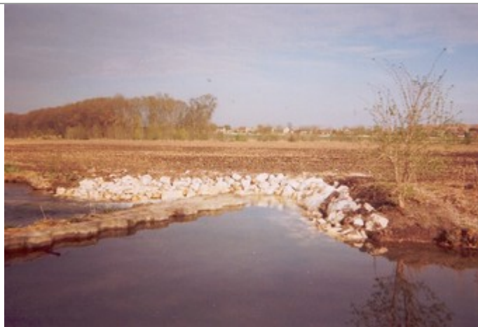
La même au mois d'avril 2003

Après reconstruction de l'ouvrage empêchant l'Yévrette de dévier de son lit, le niveau semble s'être stabilisé, constatation que l'on peut faire le long de la rue Charlet, même par temps sec. On voit nettement la différence de niveaux des deux parties sur la photo de droite.