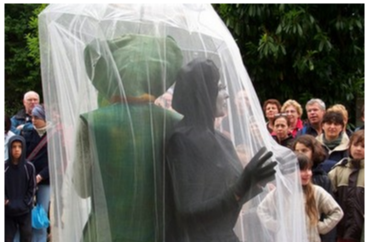
Dernier tableau, enveloppé d'un voile de mystère