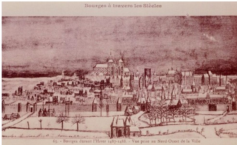
Bourges, durant l'hiver 1487-1488 ~ Vue prise au nord-ouest de la ville