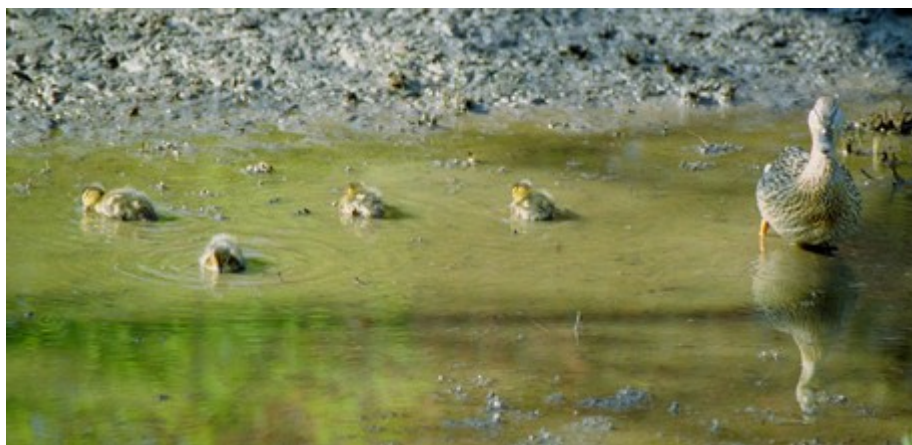
Un havre de paix au milieu d'un quartier chaotique ...