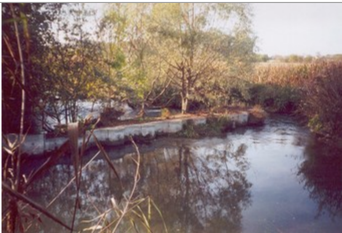
L'Yévrette au mois de décembre 2001