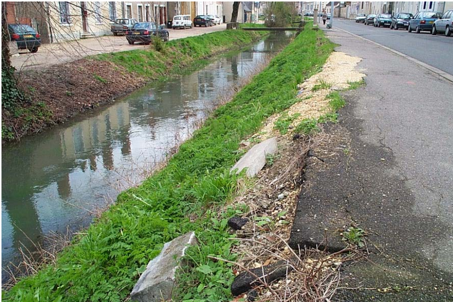
Les abords de l'Yévrette, toujours aussi accueillants

----- ✂ ----- ADHÉSION A L'ASSOCIATION DU QUARTIER CHARLET ANNÉE 2002 A renvoyer au siège de l'association : 28, Rue des Lauriers - 18000 BOURGES Mme Mlle M. :