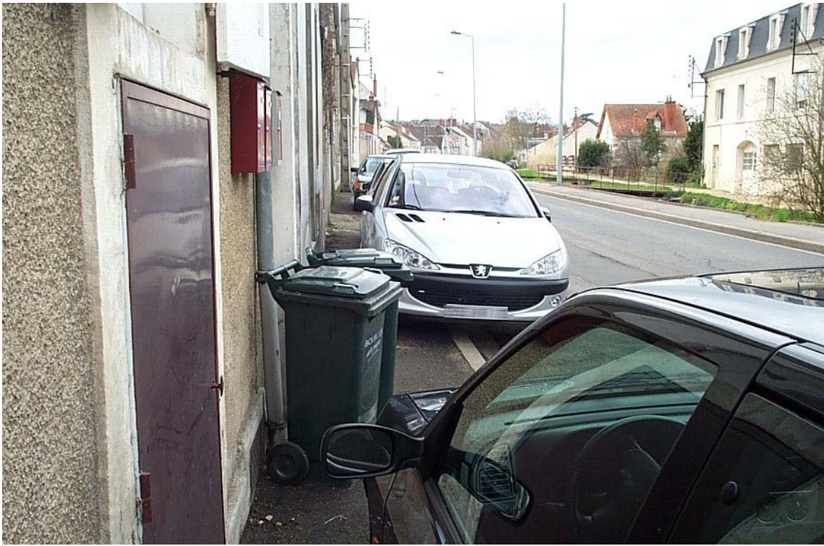
La rue Charlet aujourd'hui... et ses trottoirs quelque peu encombrés !

En arrivant du centre ville par le boulevard Clémenceau, là où se trouve la résidence "Moulin de Charlet", la scierie "Audat" était installée. Outre la production de bois de construction, les particuliers s'approvisionnaient en croûte de bois pour le chauffage. Après quelques mètres, j'attaque la rue Charlet, et à ma droite, le bar tabac "La Vivaraise" était déjà présent.